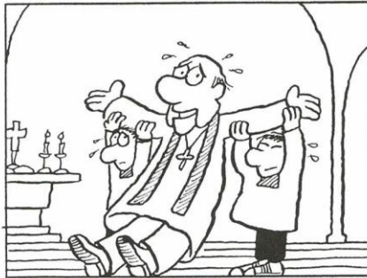
B Um den Pfarrer bei der Messe zu unterstützen

Warum gibt es in der katholischen Kirche Mini-Stranten?