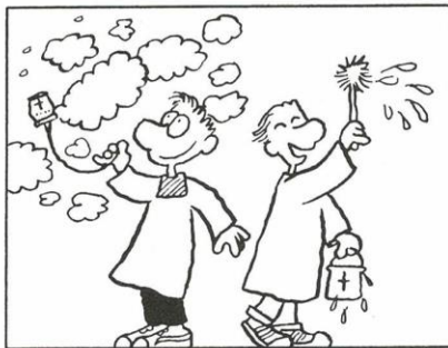
A Weil Kinder gern zündeln und mit Wasser spritzen

Die Hohenpriester, die Schriftgelehrten und die übrigen Führer des Volkes aber suchten ihn umzubringen. Sie wussten jedoch nicht, wie sie es machen sollten, denn das ganze Volk hing an ihm und hörte ihn gern.